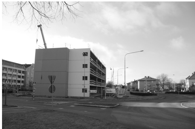
Klotet, Enslövsvägen. 2015-01-23