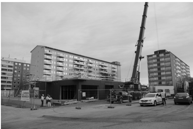
Höghuset, Föreningsgatan. 2015-05-11