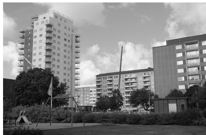
Höghuset, Föreningsgatan. 2015-08-29.