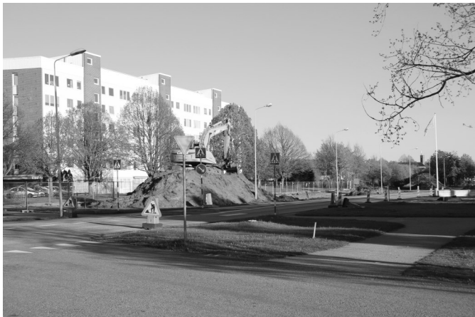
Wrangelsleden, Östergård. 2015-05-10